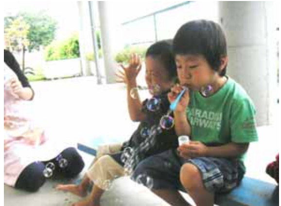
「しゃぼんだま たのしいなっ!」

えたり、お母さんと一緒に「貸して」ということで貸してもらった経験をしてきました。貸してあげた子にとっても、おもちゃを一人占めするのではなく、友だちに「貸して」と言われることで、あそびたい気持ちを我慢して人に貸すという経験もできました。その経験が、将来の子どもたちにとって必要なことと考えています。あそびたいけど貸したことで泣けてきてしまう姿もありましたが、その気持ちを大好きなお母さんに受け止めてもらう経験も積んでいます。