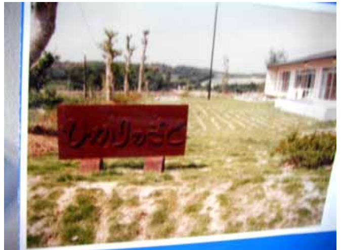
のぞみの家創立時の前庭

今後めまぐるしく変わるであろう社会情勢、福祉制度の中で、どのように継続しどのようなひかりのさとのぞみの家を築きあげていくのか、みな様にご心配をおかけしないよう、しっかりと示したいものです。次回の後編で具体的な将来像を描いて見たいと思います。