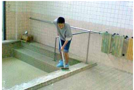
スポット実習 「相生での風呂掃除」

また、ハローワークが指揮をとるチーム支援に1人エントリーすることができました。10月には東海市にある事業所のご協力で、この地域初の「組み合わせ実習(事業所と施設を利用し、就労訓練を行う制度)」を行える手配になっています。その後は就業・生活支援センター「ワーク」や障害者職業センターのジョブコーチの支援も利用させていただきながら、ぜひ、就職を実現させていきたいと思います。