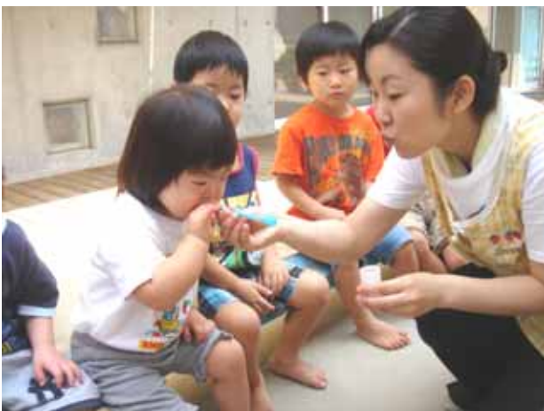
「ちからいっぱい、ふーっ!!」

一人ずつ吹き終わると、親子でしゃぼん玉あそびを楽しむ時間です。しゃぼん玉ができるのを見て「きゃー!」と喜んだり、触ってパチンツ!と割れることを楽しんだり、飛んでいくしゃぼん玉を保育者が指差し「しゃぼん玉飛んでるね。」と声かけをすると空を見上げる等ほほえましい光景がたくさん見られます。ストローを吹くのが難しい子にはお母さんと保育者とで相談して、振ればしゃぼん玉がでてくるおもちゃを使う等(右下写真)の工夫をして、子どもたちがそれぞれ楽しめる方法を考えて実行しています。