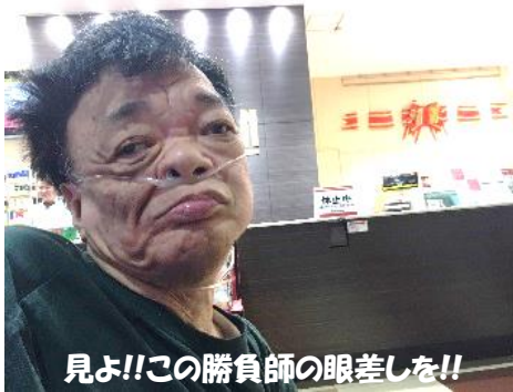
見よ!!この勝負師の眼差しを!!