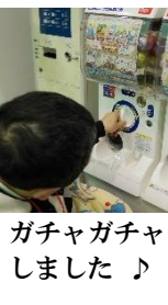
ガチャガチャしました♪