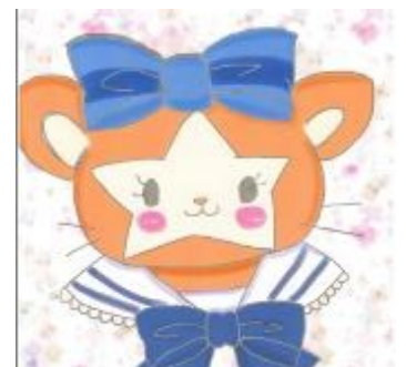
NYさん作 パソコンを使って作成されました。