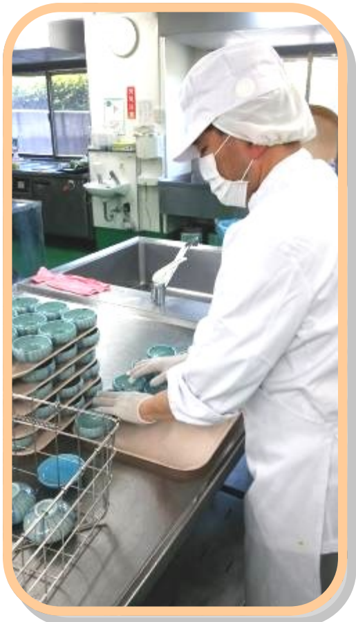
盛り付けしやすいよう、小鉢を数え、並べていくKさんです。