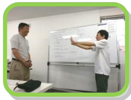
上：テーマ「祭り」で盛り上がる2人 下：テーマ「スポーツ」にチャレンジ