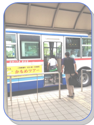
さあ、健康プラザへ出発！！

「百聞は一見に如かず」とはよく言ったもので、何事も経験に勝る学びはないのだと改めて実感しました。さて、次の待ち合わせ場所はどこにしようかな? (松村)