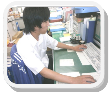
得意のPCで事務作業を行います。

Q4、至学館でのお仕事は楽しいですか？ 「楽しいです。総務課以外の課の職員さんとも話をしたりします。」