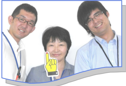
私たちと一緒に MOS検目指しましょう!