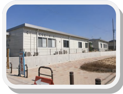
増築工事完了、手前が新館です

寒かった冬がようやく終わり、あちらこちらで春の便りが聞かれるようになってきました。毎年桜前線が北上しなどとニュースを聞くのですが、今年は愛知県より先に東京が見ごろを迎えたようです。あれれ・・・？