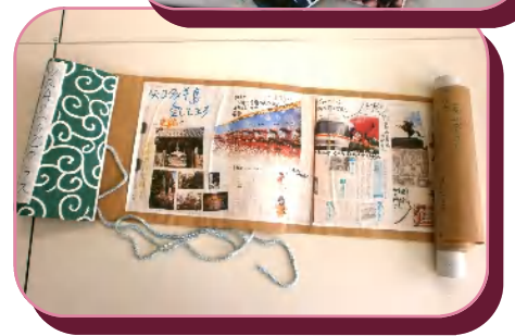
さっと取り出し、さっと広げる、「巻き物式道具箱」