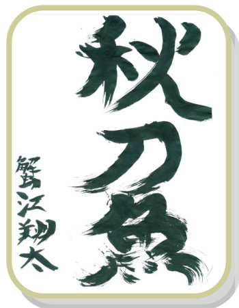
就トレ利用者の作品

愛光園 就職トレーニングセンターでは、就職を目指すプログラムとして、午前中に、国語、算数・数学の公文式学習とMOS取得を目指すパソコン学習、午後は、職場で必要なビジネスマナーや、コミュニケーション力を高める『気づきの学習』等のプログラムを実施しています。