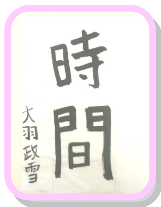
就トレ利用者の作品