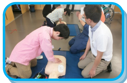
想像以上に強く押さないと効果がないことを身をもって体感できました